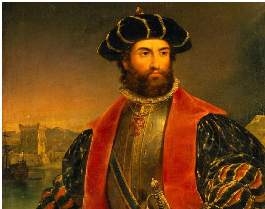
Васко да Гама после возвращения из Индии

Наконец-то Португалия имела свой торговый путь в Индию. Эта торговля принесла доходы и самому Гама, который сделался одним из самых богатых вельмож Португалии.