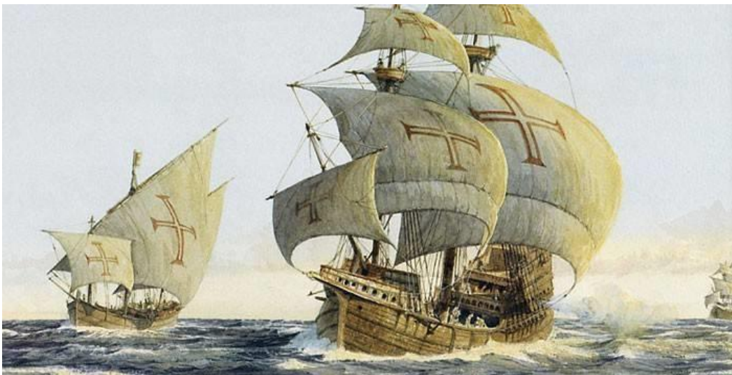
Корабли экспедиции Васко да Гама

Васко да Гама, уже 64-летний старик, вновь был вызван к королю. Ему было предложено отправиться в качестве вице-короля в Индию и восстановить там процветание португальских колоний.