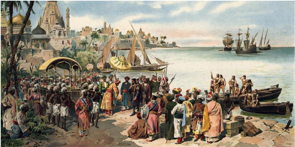
Высадка Васко да Гама на берег Индии

В 1497 году Васко да Гама отправился на поиски Индии вдоль берегов Африки. Через 4 месяца после выхода из Лиссабона обогнули мыс Доброй Надежды. В конце января эскадра вошла в устье реки Замбези. Здесь они пробыли месяц, ремонтируя корабли. Выйдя в море, они сначала шли вдоль берегов Сомали. Через некоторое время они отплыли от берегов и взяли курс на северо-восток. Через 23 дня, корабли встали на якорь в Каликуте.