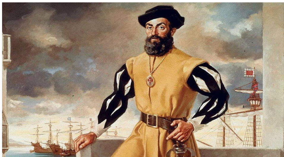
Васко да Гама

«Привезенный груз пряностей стоил в 60 раз дороже, чем обошлась организация экспедиции». Экспедиция Васко да Гама.