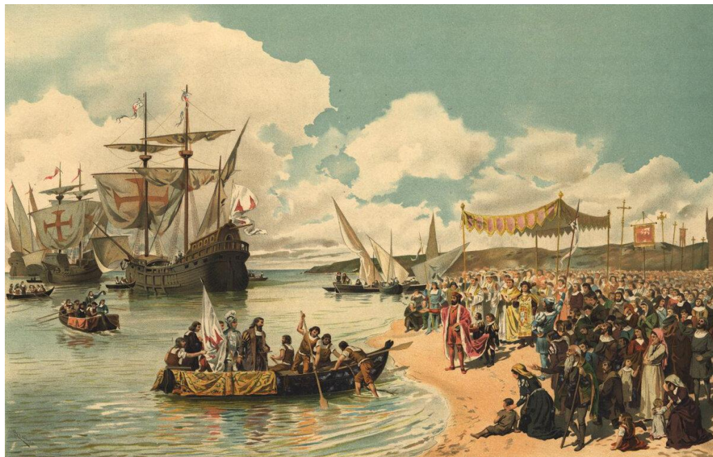
Васко да Гама отправляется из Лиссабона на поиски Индии