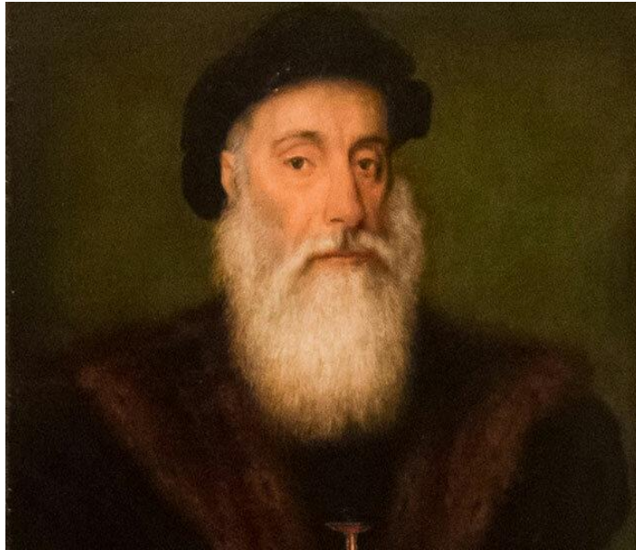
Васко да Гама – вице король Индии

Васко да Гама, уже 64-летний старик, вновь был вызван к королю. Ему было предложено отправиться в качестве вице-короля в Индию и восстановить там процветание португальских колоний.