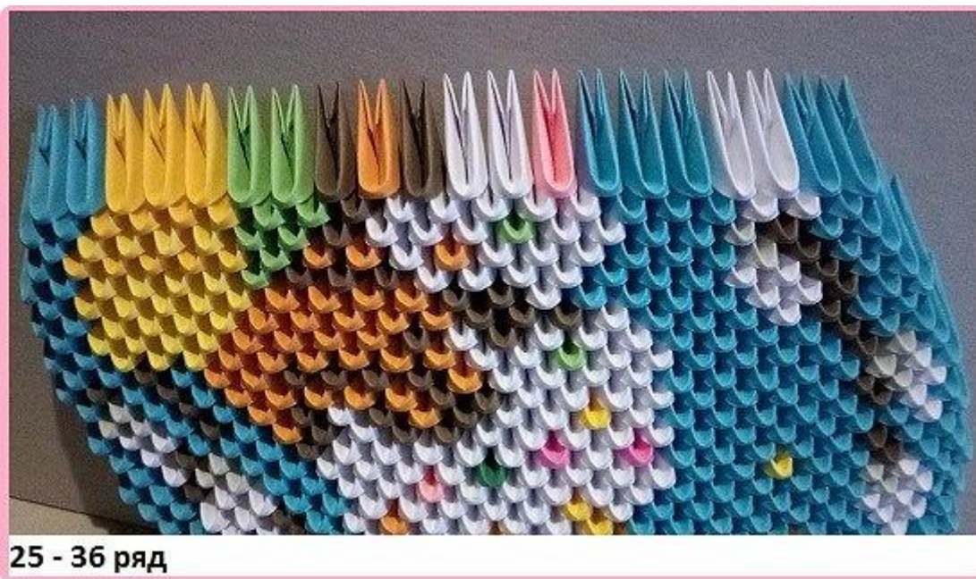
25 - 36 ряд