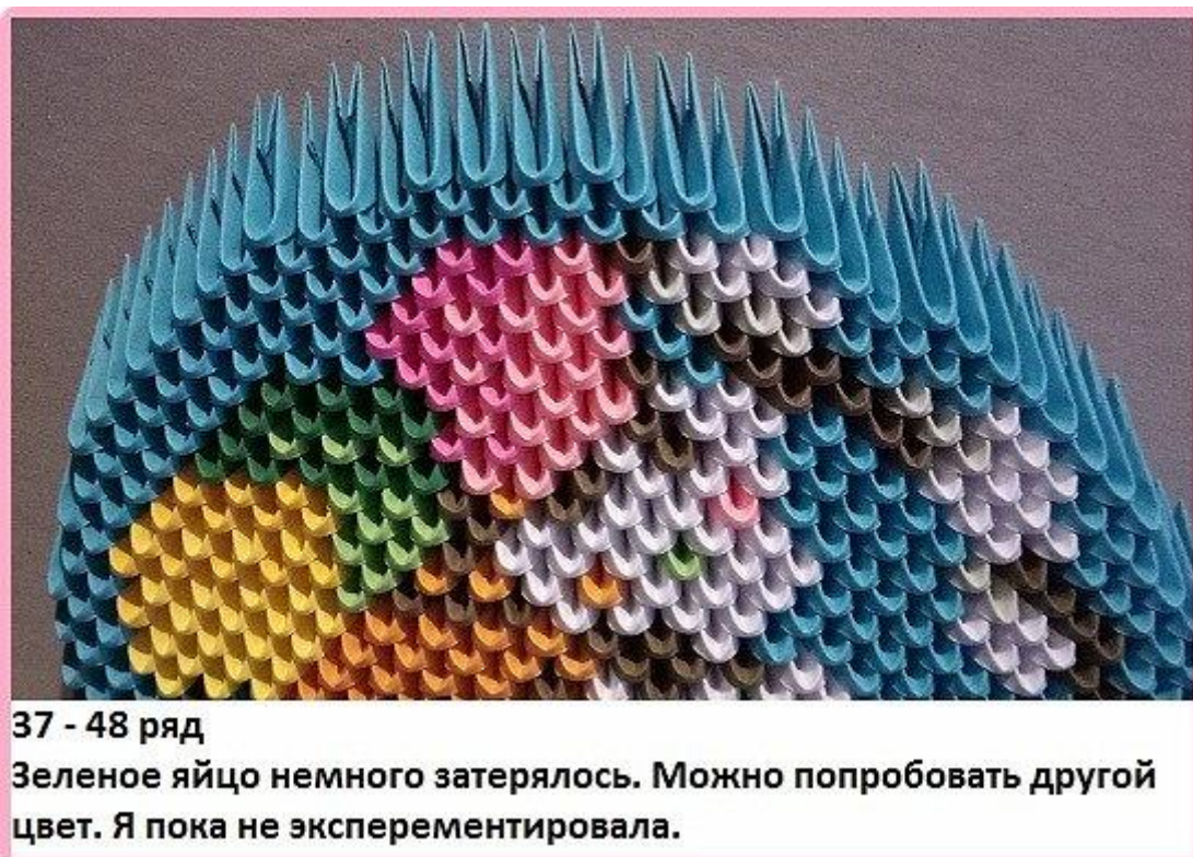
37 - 48 ряд

Зеленое яйцо немного затерялось. Можно попробовать другой цвет. Я пока не экспериментировала.