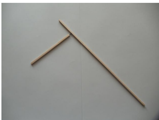
Рис. 5 Мачта и гик соединенные английскими булавками.

- Мачту сделать из деревянной рейки длиной 25 см. К концу заострить. Гик сделать из деревянной рейки длиной 10 см. прикрепить к мачте подвижно при помощи двух булавок с колечком, продетых одна в другую.