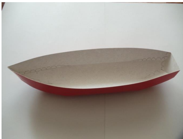
Рис.2 Склеенный корпус яхты