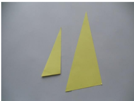
Рис. 6 Паруса для яхты