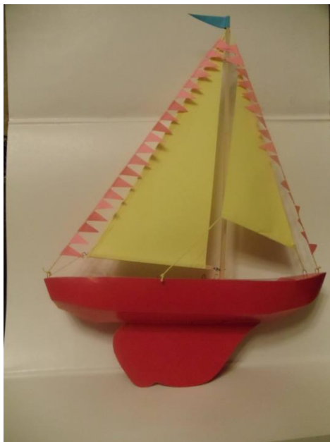
Рис.7 Готовое изделие. Общий вид.

- Приклеить их на рей, гик и мачту и установить на яхту.