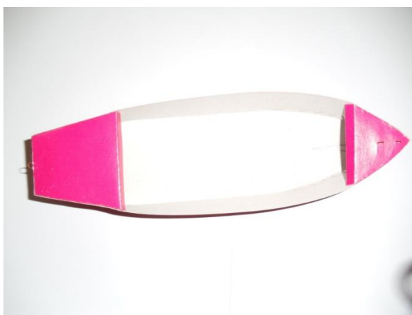
Рис. 3 Носовые и кормовые части палубы.